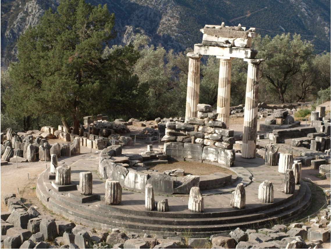
Delphes : le temple de l'oracle, la Pythie.