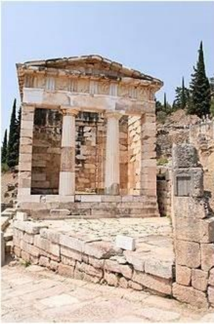
Le trésor des Athéniens.

Ce bâtiment abritait les offrandes des Athéniens au dieu Apollon.