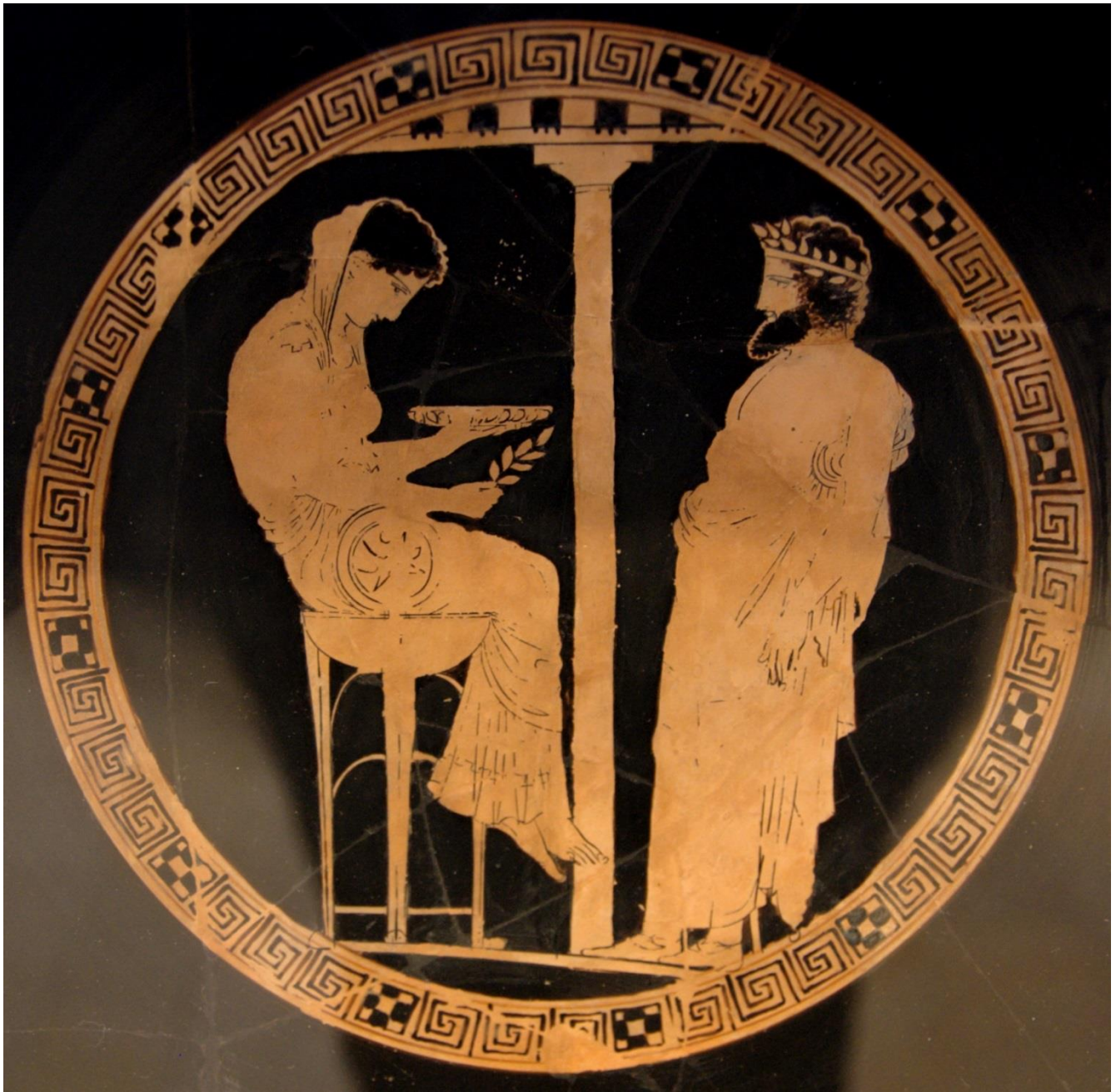
La Pythie, vase grec, 440-430 av J.C.

La Pythie, assise dans une salle du temple d'Apollon, parlait au nom du dieu. Elle répondait aux questions, dans un langage énigmatique.