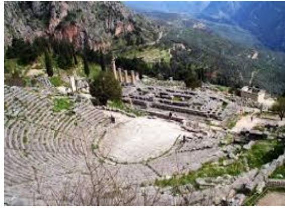
théâtre et temple d'Apollon.

Les anciens Grecs de toutes les cités venaient y consulter la Pythie , prêtresse qui rendait des oracles , censés être