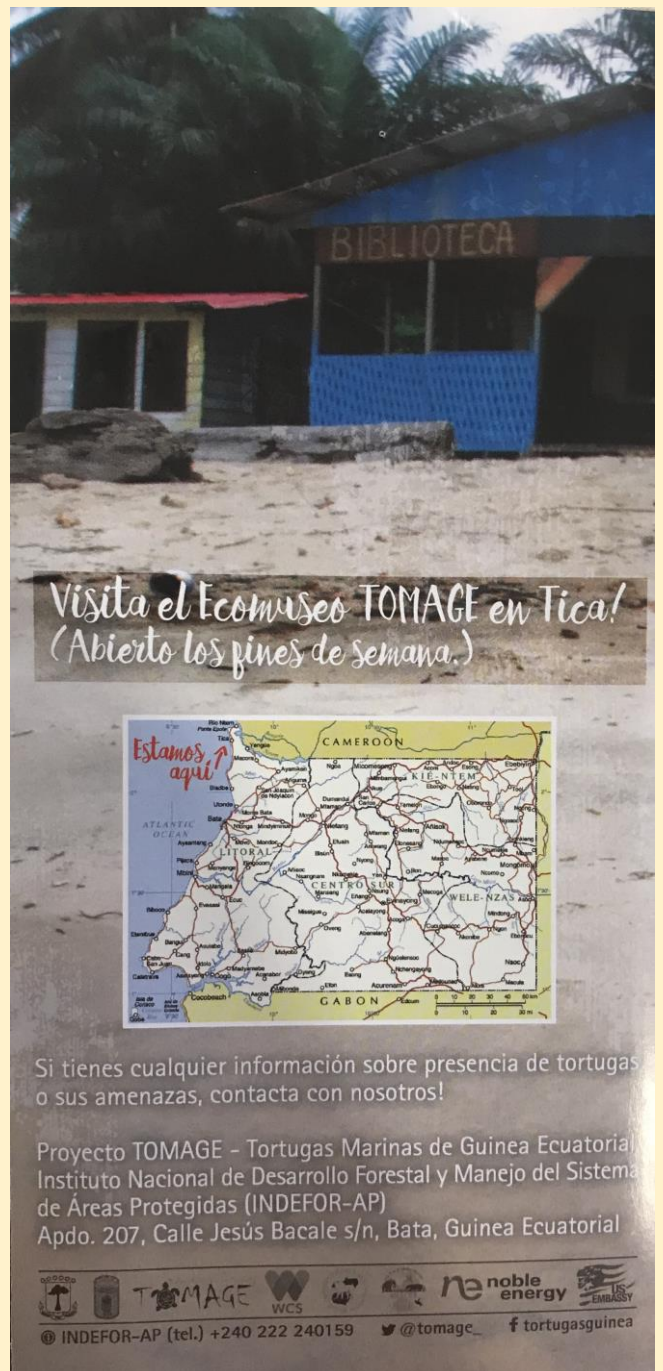
Extraits d'une brochure sur la protection des tortues marines en Guinée Equatoriale

Nous avons tous appris beaucoup de choses, alors voici les phrases que les enfants ont écrites suite à cette rencontre :