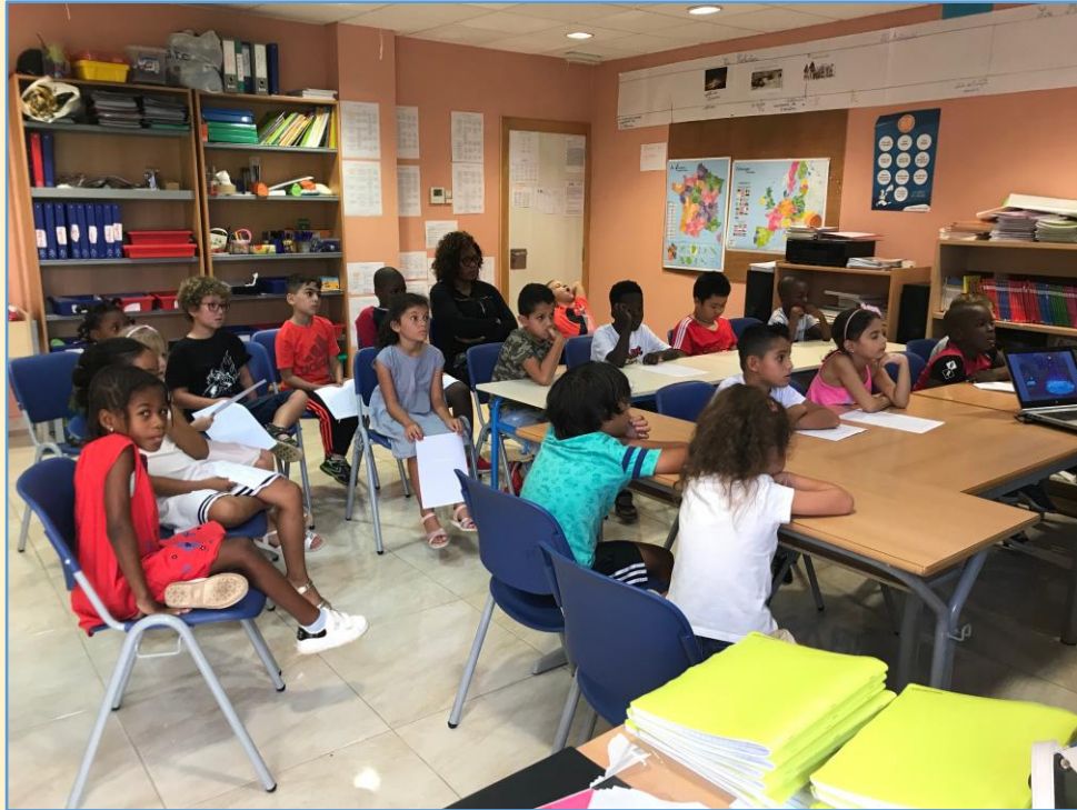
Tout le monde est bien attentif pour en savoir plus sur les tortues.